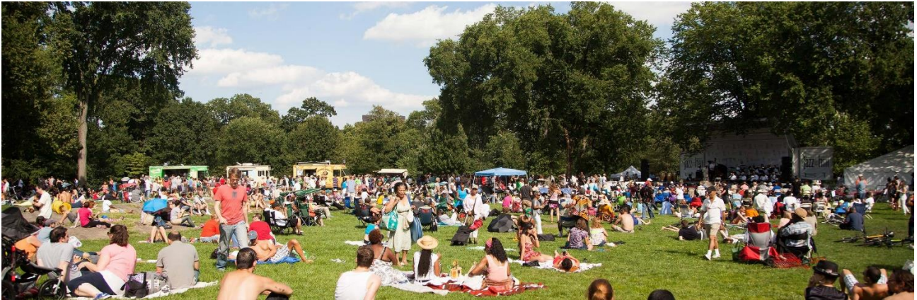
写真はいつもの春の様子